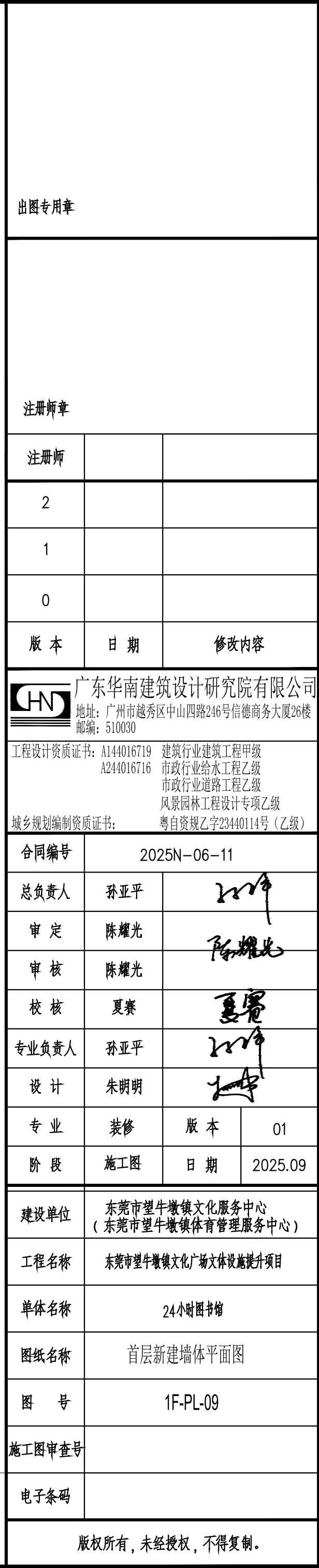
首层新建墙体平面图 PLAN SWCLE 1:50@ A2